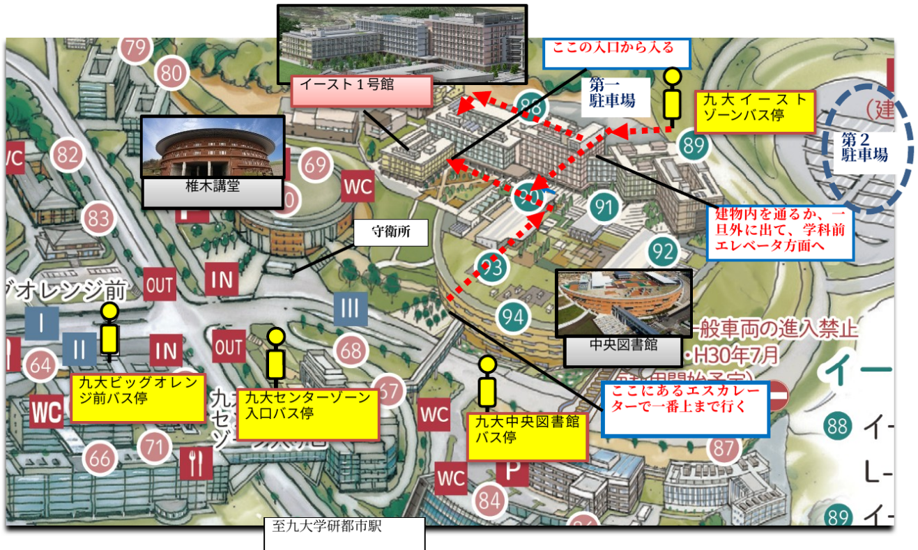
キャンパス内案内図：バス停・駐車場からイースト1号館へ

イースト1号館内にあります。各バス停・駐車場からの位置関係は下図をご参照ください。